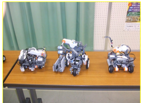
写真④ 各チームのロボット