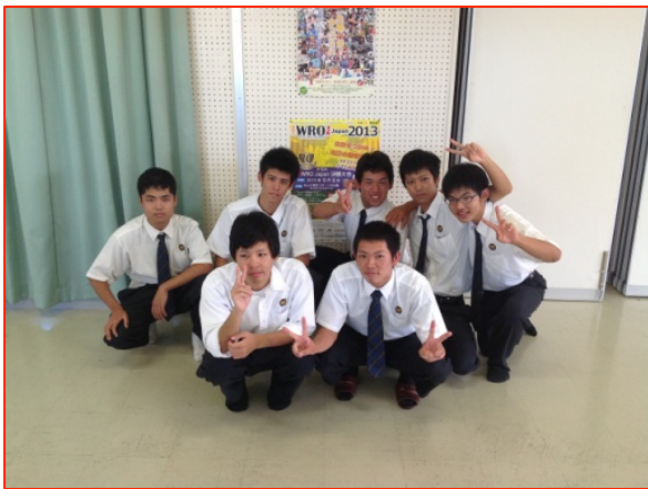
写真① 大会に参加した生徒

本校からは、3年生3チームが参加。昨年度に引き続き2連覇を目指したが、残念ながら優勝することはできなかった。現在は、1月に行われる課題研究発表に向けてロボットの改良に取り組み、後輩に引き継ぐために頑張っている。